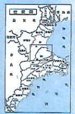
松阪処理区管内流量観測施設一覧